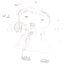
(d) bé Hoa

Bài 5. Gạch dưới bộ phận trả lời cho câu hỏi "Làm gì?" trong các câu sau: