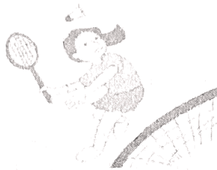
(b) chị Mai