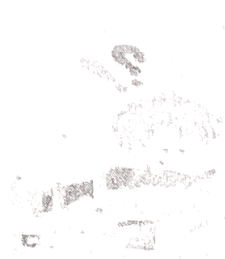
(a) bạn Hùng

Bài 4. Dùng câu kiểu "Ai làm gì?" để kể lại hành động của những nhân vật trong các bức tranh sau: