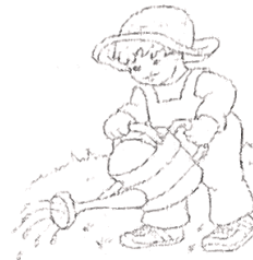
(c) bé Bin